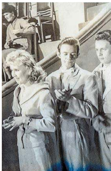
Екатерина Савинова, Евгений Ташков, Вячеслав Невинный на вечере выпускников ВГИКа. 1950

ся, потому что им хочется рассказать о себе, поделиться, и вообще приятно вспомнить прошлое. А молодежь обычно не любит слушать старых. У молодых все впереди — надежды, мечты, все. У них свои дела всегда, спешат, торопятся, а ты думаешь: «Ну вот, теперь этим воспоминаниям конца-краю не будет». А если они малоинтересны, то стараешься отделаться поскорее. И со мной это было. Если встретишь в трамвае, думаешь: «Скорей бы остановка — да сойти. Своих дел много, а тут еще она со своими рассказами». Но чаще мне интересно. Вот человек уже прожил жизнь — что он вывел в итоге: по-моему, ему ясно, что он делал верно и что нет, и вообще, какие у него сформировались взгляды на эту